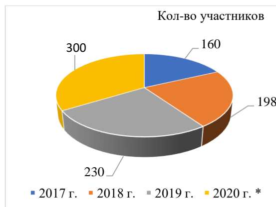
Рис. 3. Участники краевой конференции «Опыт, инновации и перспективы организации исследовательской и проектной деятельности дошкольников и учащихся»

Работники ЦТРИГО вошли в состав организаторов V межрегиональной краевой конференции «Опыт, инновации и перспективы организации исследовательской и проектной деятельности дошкольников и учащихся» (рис. 3), были модераторами секций (в том числе и секции «Педагогическое управление исследовательской и проектной деятельностью дошкольников и младших школьников»), представили свои доклады на заседаниях секций (прил. 3).